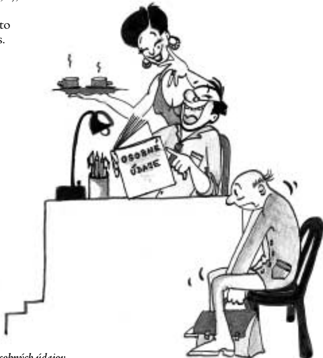
• Ochrana osobných údajov