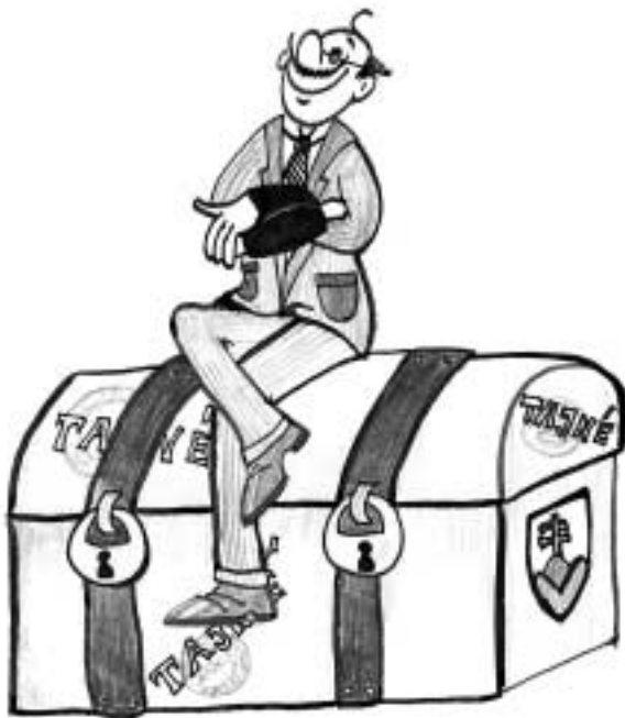
• Štátne tajomstvo